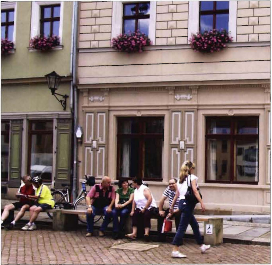
Marktdag in Pirna

of 'actief' kunt maken als je zelf wilt. En daarbinnen is ook ruime keus. Dresden is rijk aan oude kunst, maar heeft ook de Neustadt met een rebelse jeugdcultuur, en Leipzig heeft juist een traditie op het gebied van hedendaagse kunst, en bruijt dankzij de aanwezigheid van een universiteit. De opera in Dresden is een bezoek meer dan waard, maar Leipzig heeft het Gewandhaus met zijn internationaal gerenommeerde orkest. De bourgondiërs kunnen kiezen uit de niet te ingewikkelde kost in een Biergarten of experimenteren met de streekkeuken van Saksen of gerechten uit Bohemen en Polen. Wie de muziek wil met de knop op tien, gaat uit in de Neustadt van Dresden of in Leipzig;